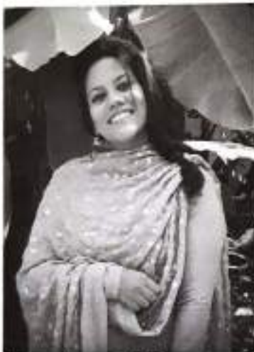
Angel Baby 2 nd DC Thriple Main Elocution (Malayalam) - A