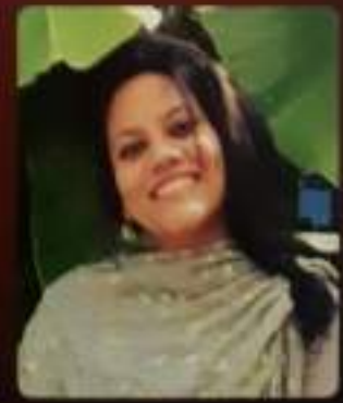
Angel baby (2 nd dc Thriple main) Sub editor